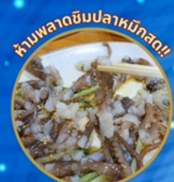
ห้ามพลาดชิมปลาหมึกสด!!

ชมซากุระจุใจ เทศกาลจินแฮ ชมดอกคามิเลียที่เกาะดองแบกโซม แวะถ่ายรูปทุ่งดอกคาโนล่า เหลืองอร่าม นั่งเคเบิลคาร์ ชมทะเลปูซาน ห้ามพลาด!! ตลาดปลาที่ใหญ่ที่สุด เซคอินแหล่งสุดชิค The Bay101 ช้อปปิ้งตลาดพื้นเมือง อิสระช้อปปิ้งได้ดิน ชัมยอน Lotte Duty Free