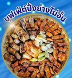
แพฟฟิตปังย่างไฉ่ฉวน