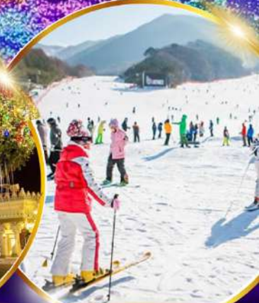
สนุกสุดมันส์ สกีรีสอร์ท

ชมจอ LED ขนาดยักษ์ที่รีสอร์ท 5 ดาว ใหญ่ที่สุดในเอเชียเหนือ สัมผัสมหะศจรรย์ที่รีสอร์ท สนุกสุดมันส์ สวนสนุกเอเวอร์แลนด์ ชมพระราชวังคยองบกคยอง ย้อนอดีตหมู่บ้านบุกซอน อันออก อิสระ-ช้อปปิ้งคังนัม Lotte Duty Free