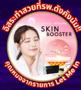
อิสระทำสวยที่พ.ดังคังนัม!! SKIN BOOSTER คุณงามความดี Let Me In

ชมจอ LED ขนาดยักษ์ที่รีสอร์ท 5 ดาว ใหญ่ที่สุดในเอเชียเหนือ สัมปัสหิมะสกีรีสอร์ท สนุกสุดมันส์ สวนสนุกเอเวอร์แลนด์ ชมพระราชวังคยองบกกุง ย้อนอดีตหมู่บ้านบุคซอน อันอก อิสระช้อปปิ้งคังนัม Lotte Duty Free