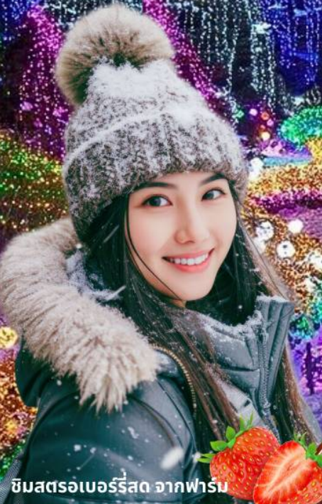
ชิมสตรอเบอร์รี่สด จากฟาร์ม