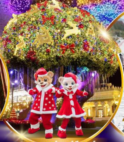
สวนสนุกเอเวอร์แลนด์ ฮิม พาร์ค