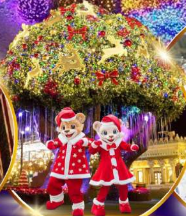
สวนสนุกเอเวอร์แลนด์ ฮิม พาร์ค