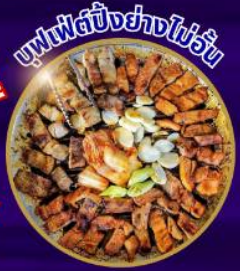
บุฟเฟ่ต์ปิ้งย่างไม่อั้น