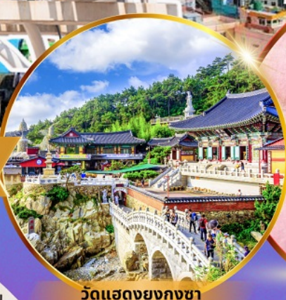
วัดแสดงยงกุงซา