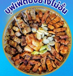
บุฟเฟ่ต์ปิ้งย่างไม่อั้น