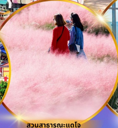
สวนสาธารณะแดโจ