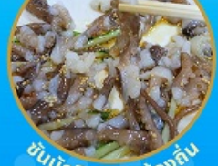
ซินนิกอิ อาหารท้องถิ่น