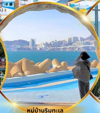
หมู่บ้านริมทะเล