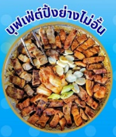
บุฟเฟ่ต์ปังอย่างไม่อื่น