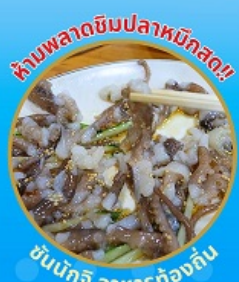
ห้ามพลาดชิมปลาหมึกสด!!

ถ่ายรูปชิคๆ หมู่บ้านวัฒนธรรมคิมซอน ใหม่ล่าสุด คาเฟ่ริมทะเล วิวหลักล้าน ซินเคเบิลคาร์ ชมทะเลปูซาน ห้ามพลาด!! ตลาดปลาที่ใหญ่ที่สุด ชิมของอร่อยที่ตลาดแฮอนแด ช้อปปิ้งตลาดพื้นเมือง แหล่งช้อปปิ้งใต้ดิน ซัมซอน อิสระช้อปปิ้ง Lotte Duty Free