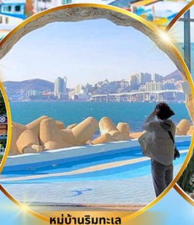
หมู่บ้านริมทะเล