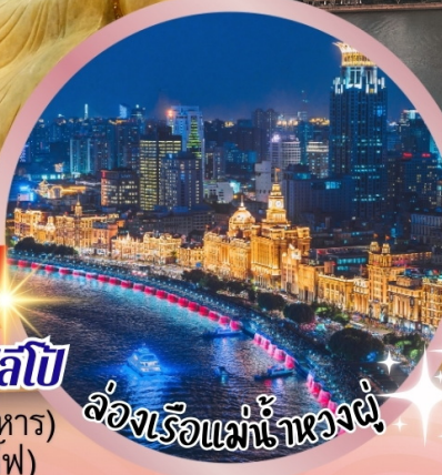
ล่องเรือแม่น้ำหวงผู่