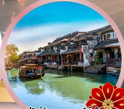
หมู่บ้านโบราณซีตัง

พิเศษ...ชื้อครอกหมูอุซึ เสี่ยวหลอเปา ชาหมูเชียงใหม่