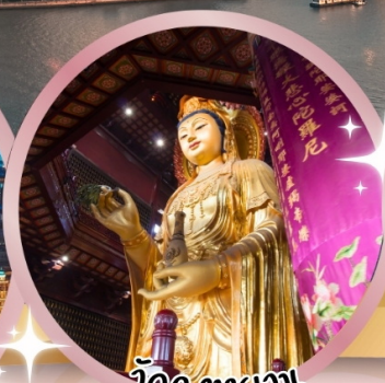
วัดฉงหยวน