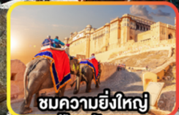
ชมความยิ่งใหญ่ ป้อมอัครา