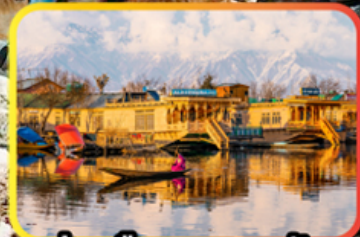
ล่องเรือทะเลสาบคิล