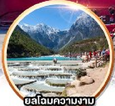
ยลโฉมความงาม คุนเฉาพระจันทร์สีน้ำเงิน

เดินทาง 23-28 มี.ย. 67 08-13 / 15-20 ก.ย. 67 6 วัน 5 คืน