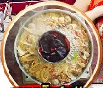
เมนูพิเศษ!! สุกี้เห็ดโตดำ+ปลาเซลมอน