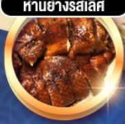
ห่านย่างรสเลิศ