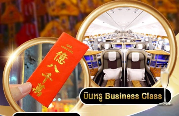
บินหรู Business Class