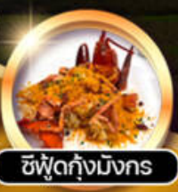
ซีฟู้ดกุ้งมังกร