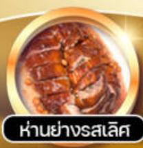
ห่านย่างรสเลิศ