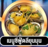
เม็บบูซึ่ดสิ่ยมูนุ่น