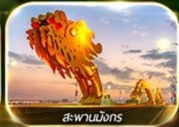
สะพานมังกร

สัมผัสความงามหมู่บ้านฝรั่งเศสที่มานาฮิลล์ ช้อปปิ้ง POPMART