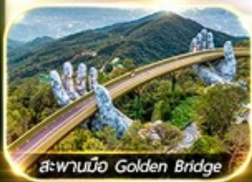
สะพานมือ Golden Bridge