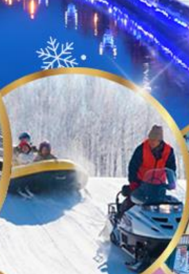
ซึทึโฮ สโนว์แลนด์