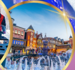
โรงงานช็อคโกแลต ชิโรอิ โคอิมีโตะ