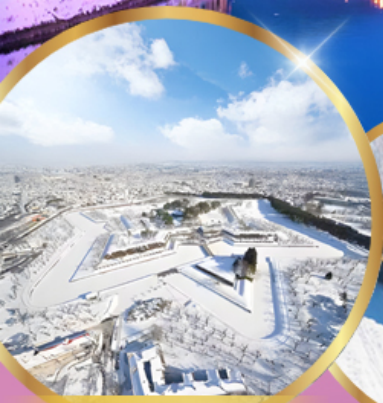
ป้อมโทเรียวคาคุ