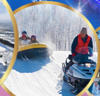
ซิกิไซ สโนว์แลนด์