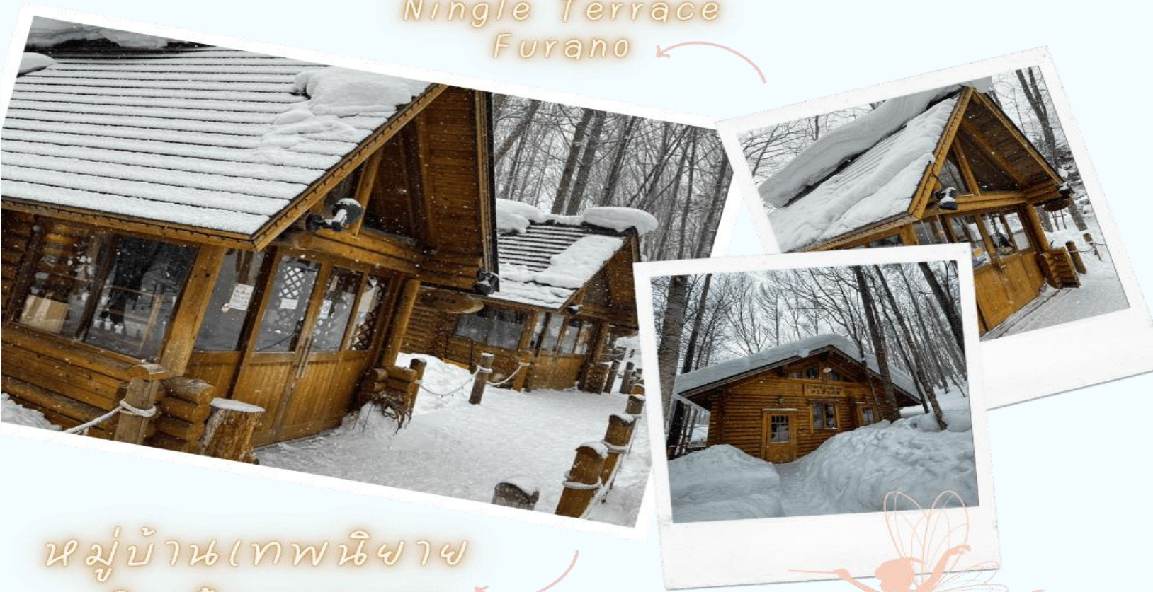
หมู่บ้านเทพนิยาย นิงเกิ้ลเทอเรส