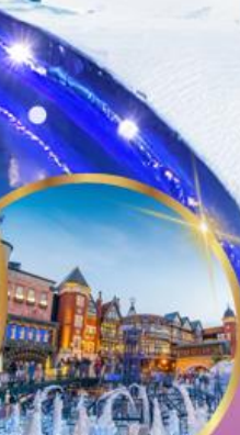
โรงงานช็อคโกแลต ชิโรอิ โคอิมีโตะ

ราคา เริ่มต้น 36,919 บาท รวมภาษีมูลค่าเพิ่ม 7%