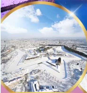
ป้อมโทเรียวกาคู