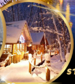
หมู่บ้านเทมมียาย นิงเกิลเทอร์ส