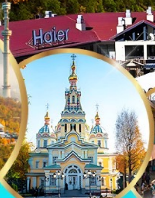
โบสถ์เซนคอฟ