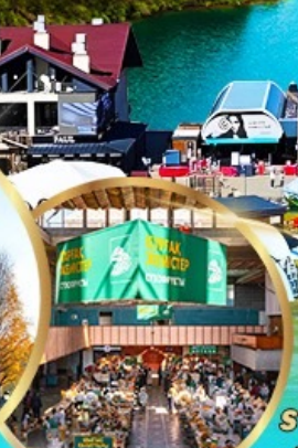
ตลาดกรีนบาร์ชา

ราคา เดียว 49,919 บาท รวมภาษีมูลค่าเพิ่ม 7%