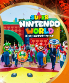
อิสระ UNIVERSAL STUDIO