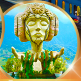
ยอดเขาฟานซีปัน