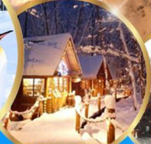
หมู่บ้านเทพนิยาย นิงเกิลทอเรส