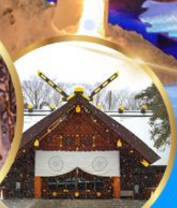
ศาลเจ้า ออกโทโต

เดินทาง 04 - 09 กุมภาพันธ์ 68 05 - 10 กุมภาพันธ์ 68