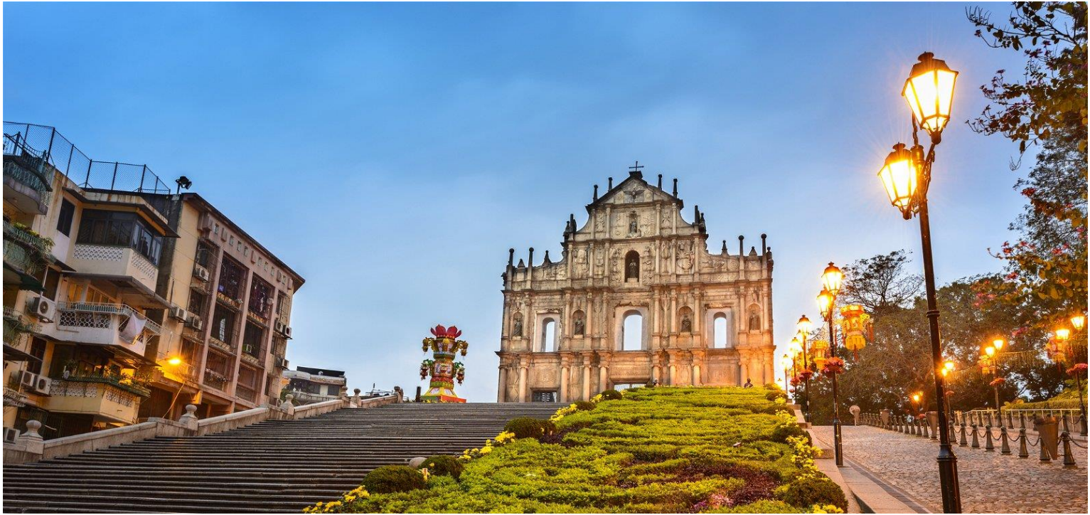
วิหารเซนต์ปอล

ออกแบบโดยสถาปนิกชาวอิตาลี ด้านหลังของโบสถ์มีพิพิธภัณฑ์จัดแสดงประวัติศาสตร์ของโบสถ์แห่งนี้ไว้ โบสถ์เซนต์ปอลได้รับการยกย่องให้เป็นอนุสาวรีย์แห่งศาสนาคริสต์ที่ยิ่งใหญ่ที่สุดในดินแดนตะวันออกไกล