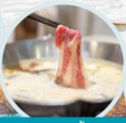
เมนูพิเศษ สุกินม่าล่า