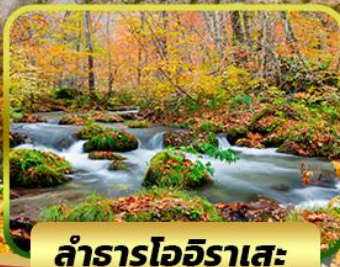
ลำธารโออิระสะ