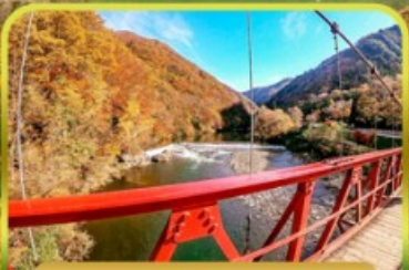
หุบเขาดาคิกาเอริ