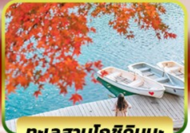
ทะเลสาบโกชิคิคุมะ