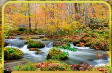
ลำธารโออิราเสะ