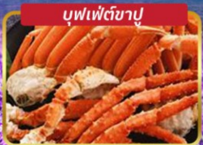
บุฟเฟ่ต์ขาปู