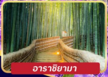
อาราชิยามา