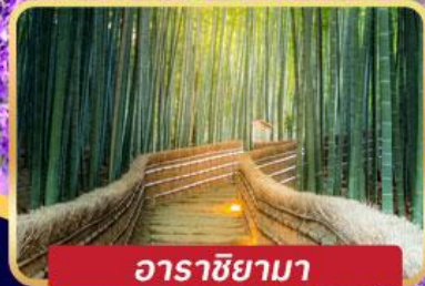
อารายาม่า