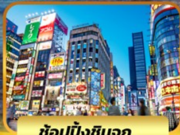
ช้อปบั้งชินจูกุ