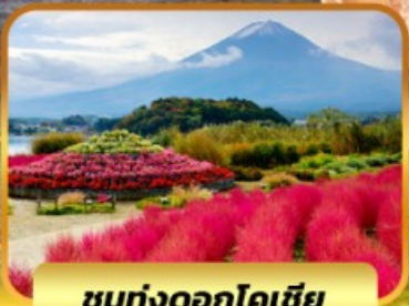
ชมทุ่งดอกโคเชีย