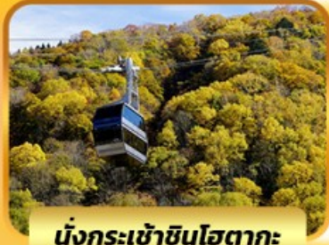
นั่งกระเช้าชินโฮตากะ