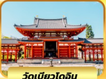
วัดเบียวโดจิน