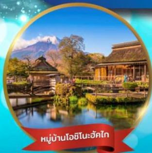
หมู่บ้านโอชิโนะฮักโก