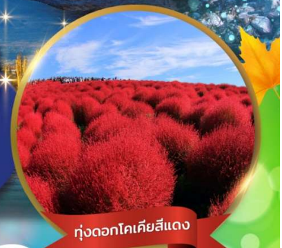
ทุ่งดอกโคเคียสีแดง

ชมใบไม้เปลี่ยนสีที่ คามิโคจิ • ทุ่งดอกโคเคีย ณ สวนชิตาชิไซด์ • ศาลเจ้าโอะฮาไรชิ ฟูจิซัน 5 • พิธีชงชา • หมู่บ้านโอะชิโนะฮักโก • ปราสาทมัตสึโมโต้ (ชมด้านนอก) โอบุระ: กันดั้ม • ซ็อบบิงชินจูกุ • อิสระเต็มวัน เที่ยวดิสนีย์ หรือ ซ็อบบิงตามอัธยาศัย