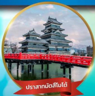
ปราสาทมัตสึโมโด้