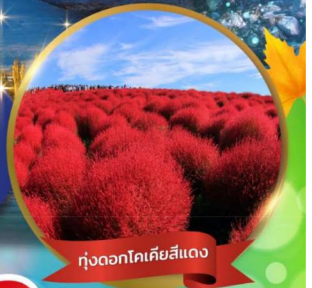
ทุ่งดอกโคเคียสีแดง

ชมใบไม้เปลี่ยนสีที่ คามิโคจิ • ทุ่งดอกโคเคีย ณ สวนชิตาชิไซด์ • ศาลเจ้าโองาโรอิ ฟูจิชั้น 5 • พิธีชงชา • หมู่บ้านโอชิโนะฮักโก • ปราสาทมัตสึโมโด้ (ชมด้านนอก) โอดะวะ กันดั้ม • ซุปป์ชิงจุกุ • อีสระเต็มวัน เกี่ยวกับสนิม หรือ ซุปป์ชิงตามอริยาตัย