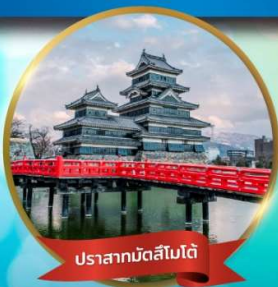
ปราสาทมัตสึโมโต้