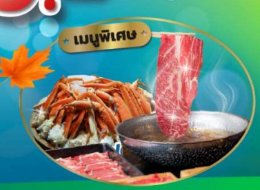
เมนูพิเศษ