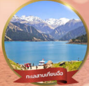
ทะเลสาบเทียนฉือ