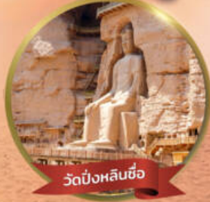
วัดปิ่งหลินซือ