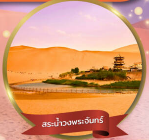
สะพานพระจันทร์