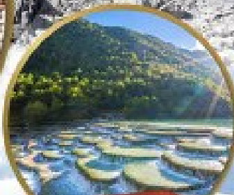
หุบเขาพระจันทร์สีน้ำเงิน