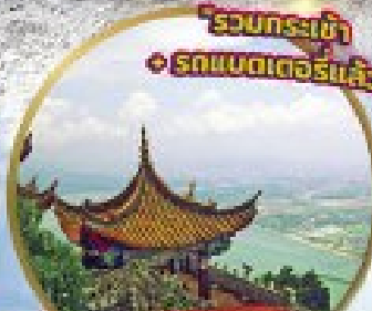
ยอดตเขาชี้ชาน