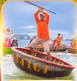
ล่องเรือกระดัง