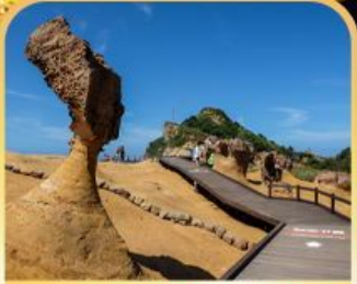
อุทยานหินเหยหลิว