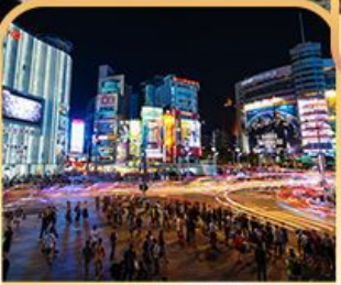
ย่านซีเหมินติง