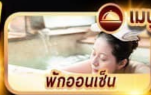
พักออนเซ็น