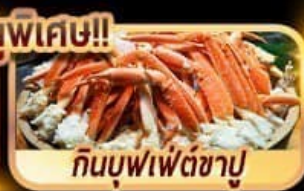
กินบุฟเฟ่ต์ชาบู