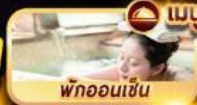
พักออนเซ็น