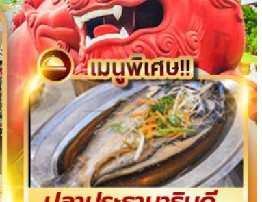
เมนูพิเศษ!! ปลาประรานาธิบดี