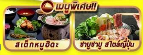
สาคูหมูฮิดะ