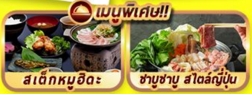
เมนูพิเศษ!! สเด็กหมูฮิดะ ซาซุซาบู สโตล์ญี่ปุ่น