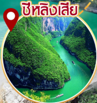
ซีหลิงเสี่ย