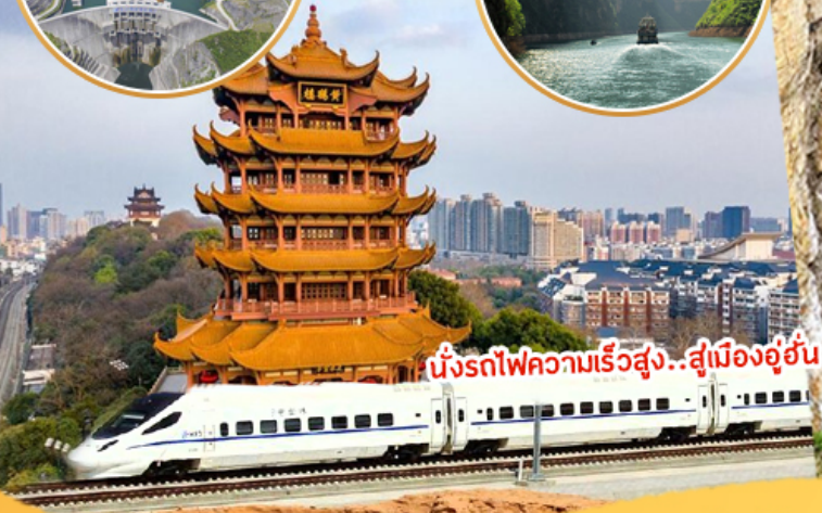
นั่งรถไฟความเร็วสูง...สู่มืองอุ๋อัน