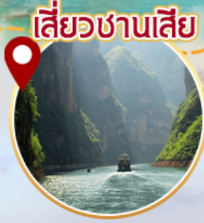
เสี่ยวชานเสี่ย