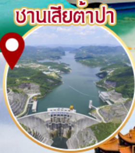
ชานเสี่ยต้าปา