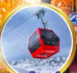
กระเช้ากุลมาร์ต ชมวิวสุดอลังการ