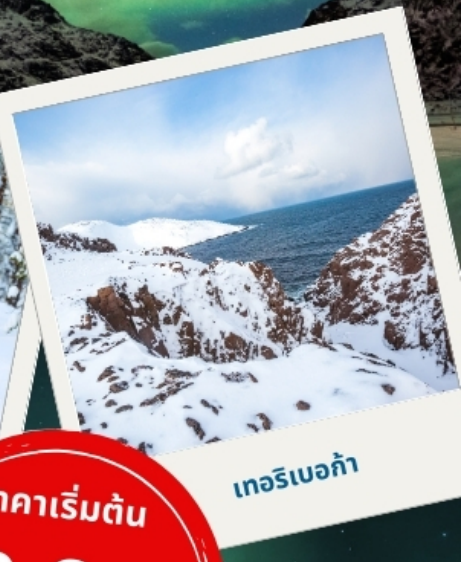
เทอริเบอก้า