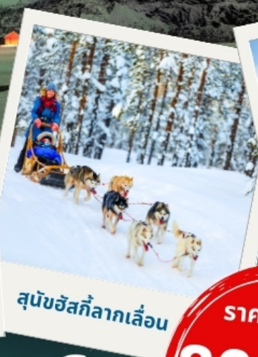
สุนัขฮัสกีลากเลื่อน