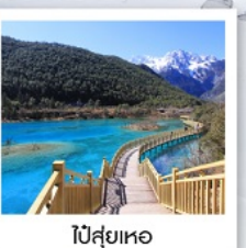
ปี่สุยเหอ

นั่งรถไฟความเร็วสูง จาก ลี่เจียง - คุณหมิง