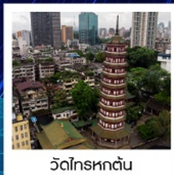
วัดโกรหดตัน

ทัวร์คุณภาพ ไม่ลงร้านช้อปปิ้ง ไม่ขายออฟชั่น