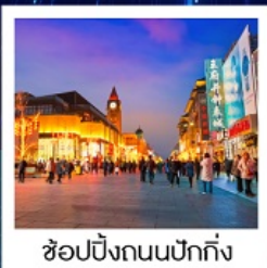
ช้อปปิ้งถนนปักกิ่ง