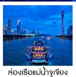
ล่องเรือแม่น้ำจูเจียง

ล่องเรือแม่น้ำจูเจียง / ช้อปปิ้งถนนปักกิ่ง / ช้อปปิ้งถนนซังซียิว / วัดโกรหดตัน / ศาลเจ้าตระกูลเฉิน / ถนนคนเดินหย่งซังฟา