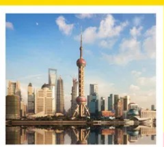
หอไข่มุก