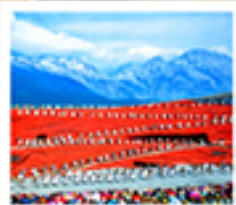
ໂຮງຈາງອວີໂທວ