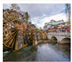
ເມືອງໂບຣານສີ່ເຈີຍ