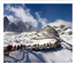
ກູເກາກິນມິງກຸຮຍ