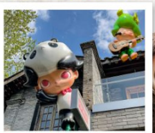
ถนนคนเดินชอยกว้างแอก