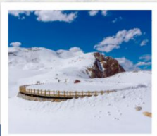
ต่ากู่ปิงชว่น