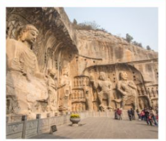
กำหินหลงเหมิน