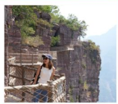
เขากิ๊ยนเจี๋ยซาน