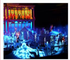
โรงละคร ONLY HENAN