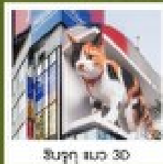
ชินจูกุ แนว 3D

คัมภีร์เมนูคุดฟิเศษ บุฟเฟ่ต์ฮามญี่ปุ่นอื่น