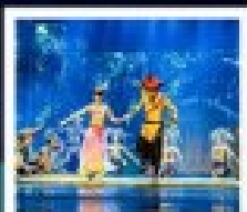
ไอซ์แลนด์