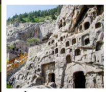
ถ้ำหินหลงเหมิน