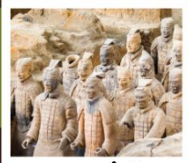
สุสานจีนซี

PERIOD 1 : 9 - 14 สิงหาคม | PERIOD 2 : 18 - 23 ตุลาคม 2567