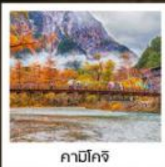
คามิโคจิ

ลิ้มรสเมนูสุดพิเศษ บุฟเฟ่ต์ซาซิมิอื่น ๆ / ซาบูระดับพรีเมียม