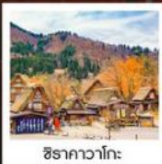
ชิราคาวาโกะ