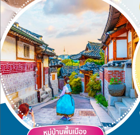
หมู่บ้านพื้นเมือง พูซอนอันนุก

สตูกองทัพบูเดซิก บาร์บีคิวบุฟเฟ่ต์ หมู เนื้อ ไม้อัน