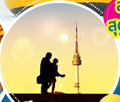
NEW! มุมลับ! ทอคอย N โซล