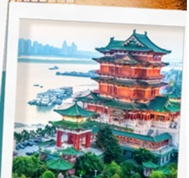
หอถึงหวังเก้อ