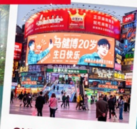
ถนนคนเดินหวงซิงสู่