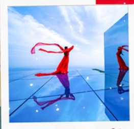
กระเจ๊กท้องฟ้า