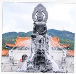
วัดฟูโกว