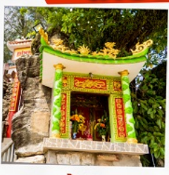
ศาลเจ้าติงซาอู