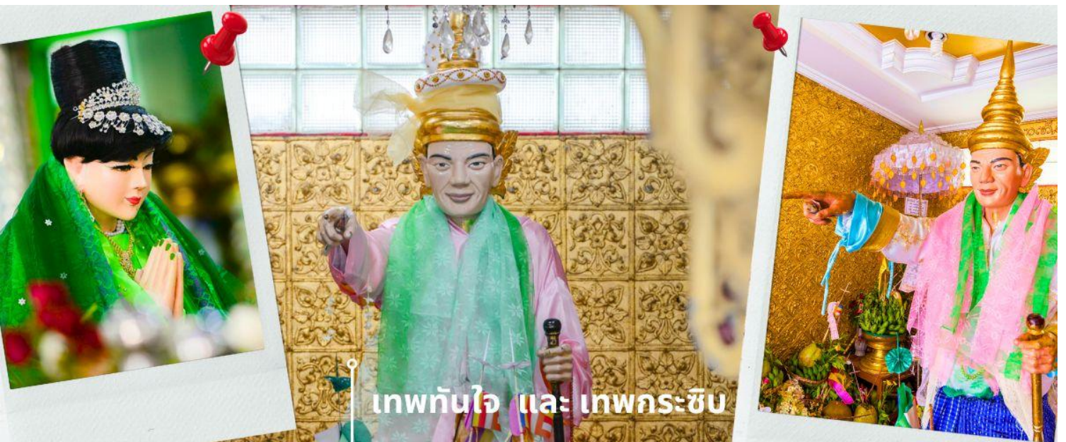
เทพทันใจ และ เทพกระซิบ

เจดีย์โบตาทาว (Botahtaung Pagoda) หมายถึง ทหาร 1,000 นาย เมื่อในอดีตพระเจ้าโองะลาปะกษัตริย์มอญ ได้ให้ทหาร 1,000 นาย ตั้งแถวถวายความเคารพพระเกศาธาตุ บรรจุไว้ 1 เส้น ในเจดีย์นี้ ที่อันเชิญมาจากอินเดีย ไฮไลท์ที่สำคัญที่นักท่องเที่ยวนิยมมาสถานที่แห่งนี้คือ การมาสักการะบูชา เทพทันใจ หรือ นัตโบโบยี และยังมี เทพกระซิบ ภายในเจดีย์เป็นที่เก็บผอบหินทรงสลูพบสมบัติล้ำค่าหลายชนิดเช่น อัญมณี, เครื่องประดับ, เพชรพลอย, จารึกดินเผา, และพระพุทธรูปทองคำ, เงิน, ทองเหลือง, หิน พระพุทธรูปจำนวนทั้งหมดภายในและภายนอกผอบราวกว่า 700 องค์ จารึกดินเผาบางส่วนเป็นเรื่องราวของคำสอนและเรื่องราวทางพุทธศาสนาของนัตโบโบยี หรือ คนไทยรู้จักกันในชื่อว่า เทพทันใจ เป็นคำเรียกเทพเจ้านัต ที่เป็นเทพารักษ์ประจำวัดหรือพระเจดีย์ในศาสนาพุทธแบบพม่า โดยทั่วไปนิยมสร้างรูปเคารพโบโบยี เป็นรูปเคารพชายสูงวัยขนาดเท่าบุคคล สวมเครื่องประดับศิระ บางครั้งถือไม้เท้าเพื่อย้ำถึงความอาวุโส เทพทันใจแห่งนี้ เป็นสถานที่ที่คนไทยให้ความนับถือเป็นอย่างมาก เชื่อกันว่าการได้มาขอพรกับ นัตโบโบยี จะสัมฤทธิ์ผลทุกประการ จนเป็นที่กล่าวถึงและเล่าขานสืบกันมาช้านาน โดยใกล้กันยังมี เทพกระซิบ ซึ่งมีนามว่า “อะมาดอว์เม็ยะ” ตามตำนานกล่าวว่า นางเป็นธิดาของพญานาค ที่เกิดศรัทธาในพุทธศาสนาอย่างแรงกล้า รักษาศีล ไม่ยอมกินเนื้อสัตว์จนเมื่อสิ้นชีวิตไปกลายเป็นนัต