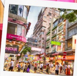
ช้อปปิงย่านมงก๊ก