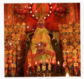
เจ้าแม่กวนอิมวัดสองฮา