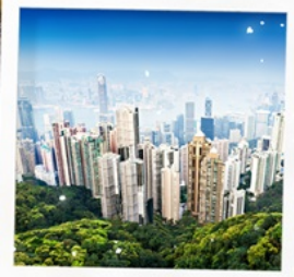
จุดชมวิวกาอิกตอเรีย