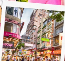
ช้อปปิ้งย่านมงก๊ก